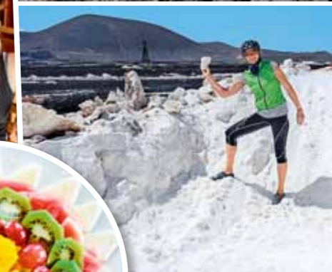
Salz statt Schnee Die Salinas de los Agujeros liegen beim Strand von Los Cocoteros