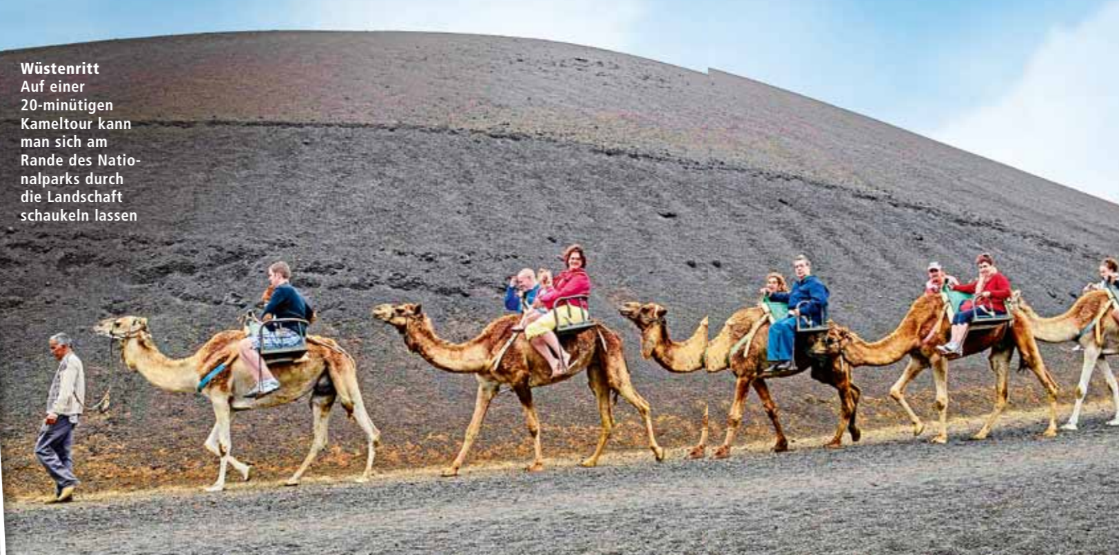
Wüstenritt Auf einer 20-minütigen Kameltour kann man sich am Rande des Nationalparks durch die Landschaft schaukeln lassen