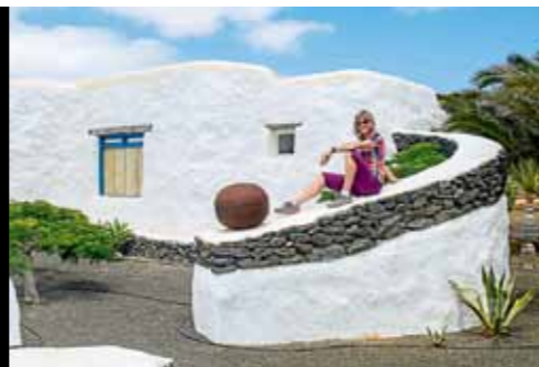
Originelle Architektur Alte Häuser wurden auf La Graciosa zu schmucken Ferienhäusern renoviert

führt, bin ich überwältigt von der Farbenvielfalt, die Vulkangestein haben kann. Besonders der Montaña Colorado, der bunte Berg, hat es mir mit seinen Gelb-, Rot- und Orangetönen angetan. Zu Recht hat die UNESCO die Insel zum Biosphärenreservat erklärt. Noch heute schlummert das Magma in den Bergen und das Restaurant „El Diabo-