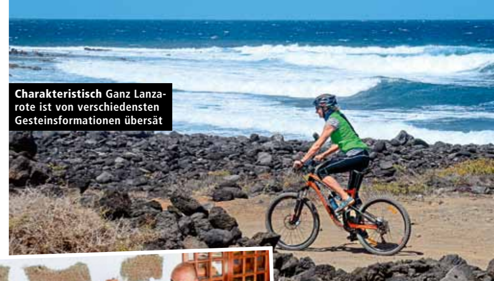
Charakteristisch Ganz Lanzarote ist von verschiedensten Gesteinsformationen übersät