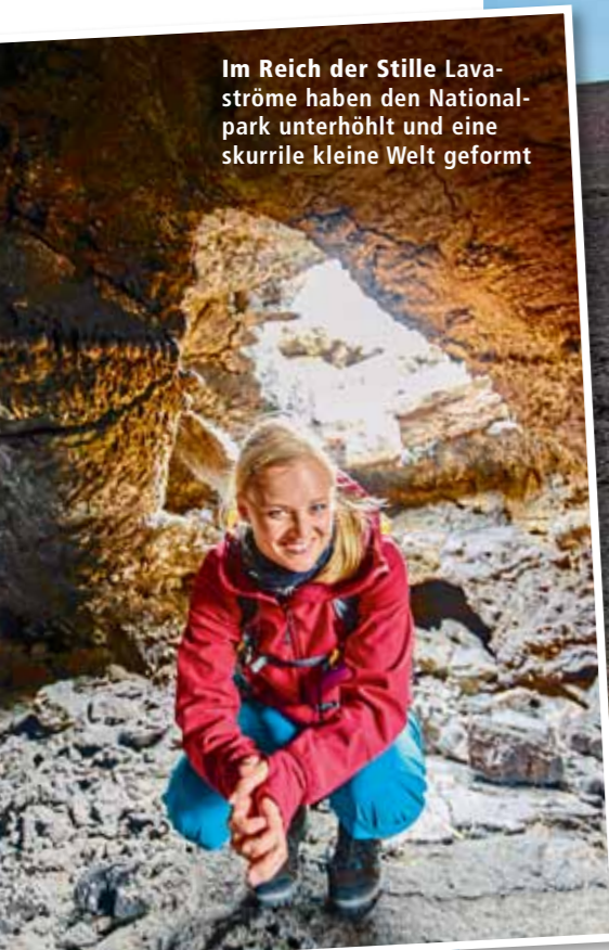
Im Reich der Stille Lavaströme haben den Nationalpark unterhöhlt und eine skurrile kleine Welt geformt