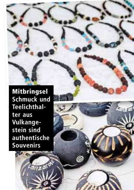
Mitbringsel Schmuck und Teelichthalter aus Vulkangestein sind authentische Souvenirs