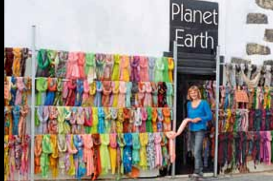
Auf Tuchfühlung In der ehemaligen Hauptstadt Tegüise laden hübsche Läden in alten Häusern zum Einkaufen ein