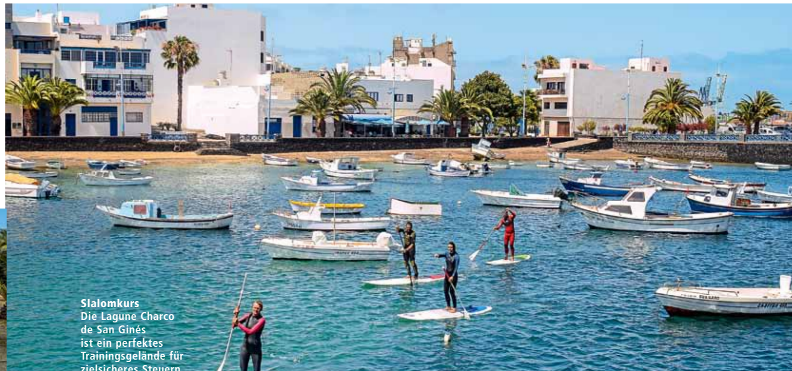
Slalomkurs Die Lagune Charco de San Ginés ist ein perfektes Trainingsgelände für zielsicheres Steuern