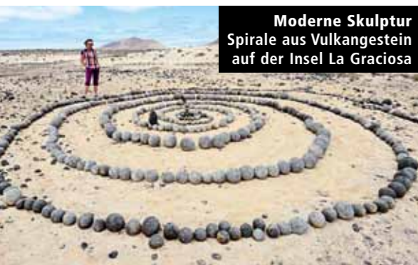
Moderne Skulptur Spirale aus Vulkangestein auf der Insel La Graciosa